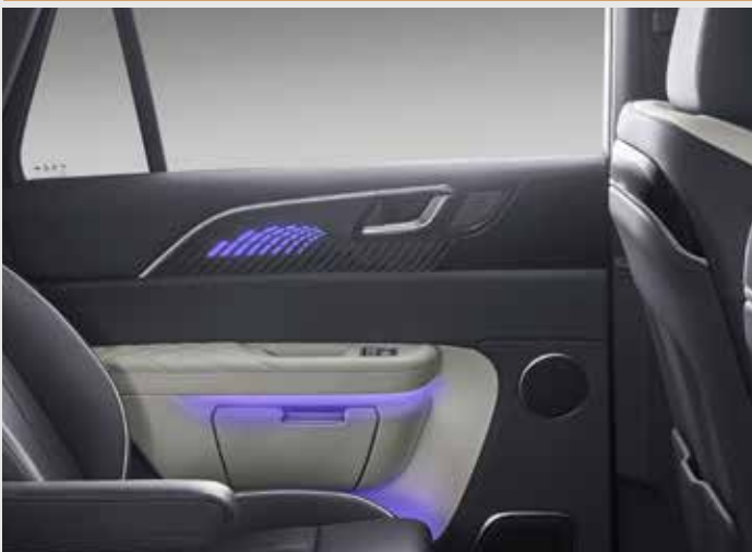
Détails du design de la deuxième rangée de sièges