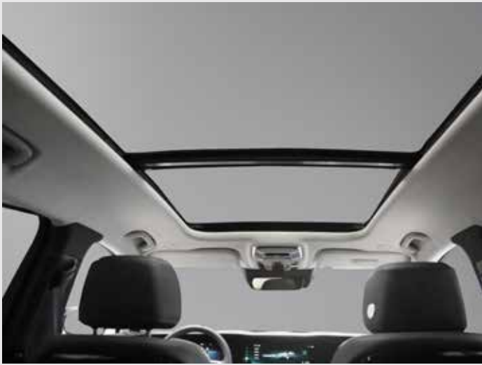
Version Business 7 places assises