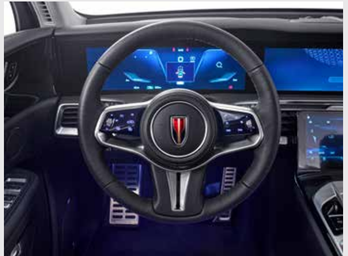
Volant intelligent à commande par capteurs