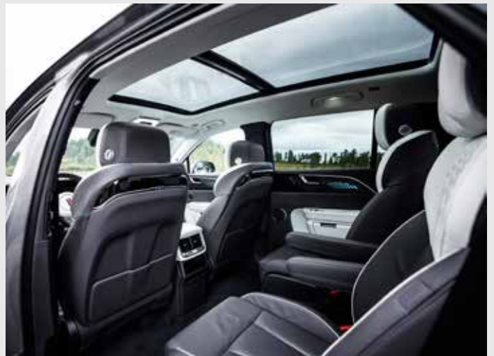
Version Président 6 places assises